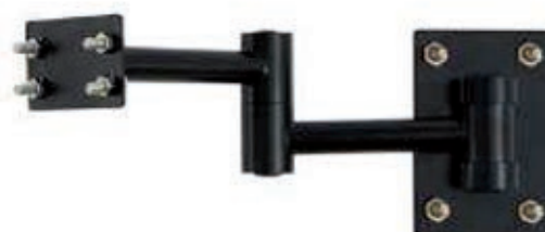
Brazo de soporte a pared