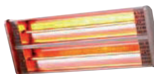
Gama TECNA RIVA 2 con dos lámparas