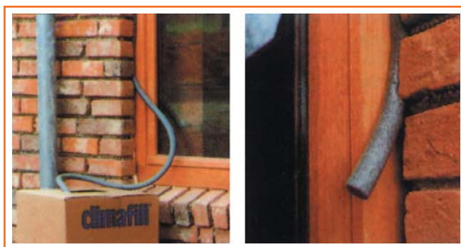
Junta de dilatación