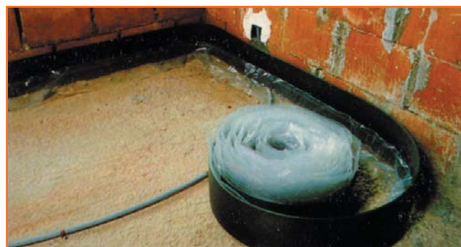
Banda de dilatación lateral, con babero de plástico