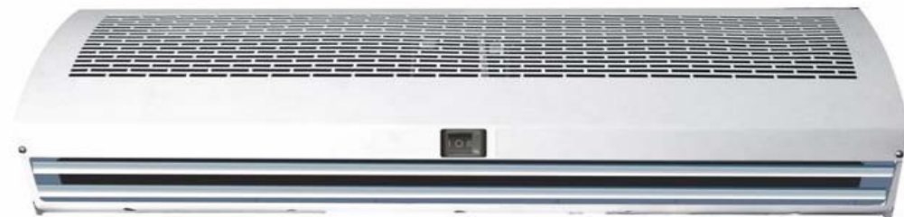
Cortina de aire Tipo FM