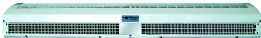
Cortina tipo FRMH