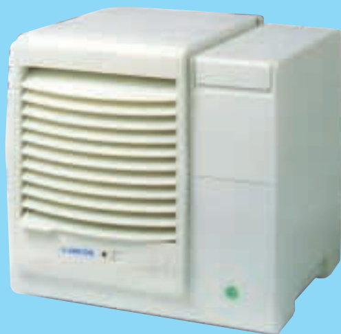
Modelo Cool Flow CF 70