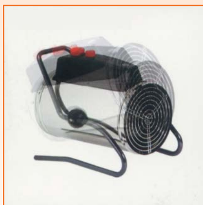
En el suelo