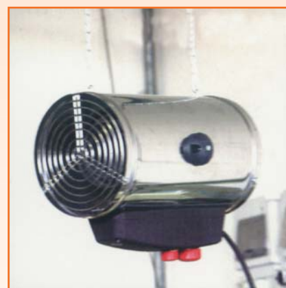
Colgado del techo