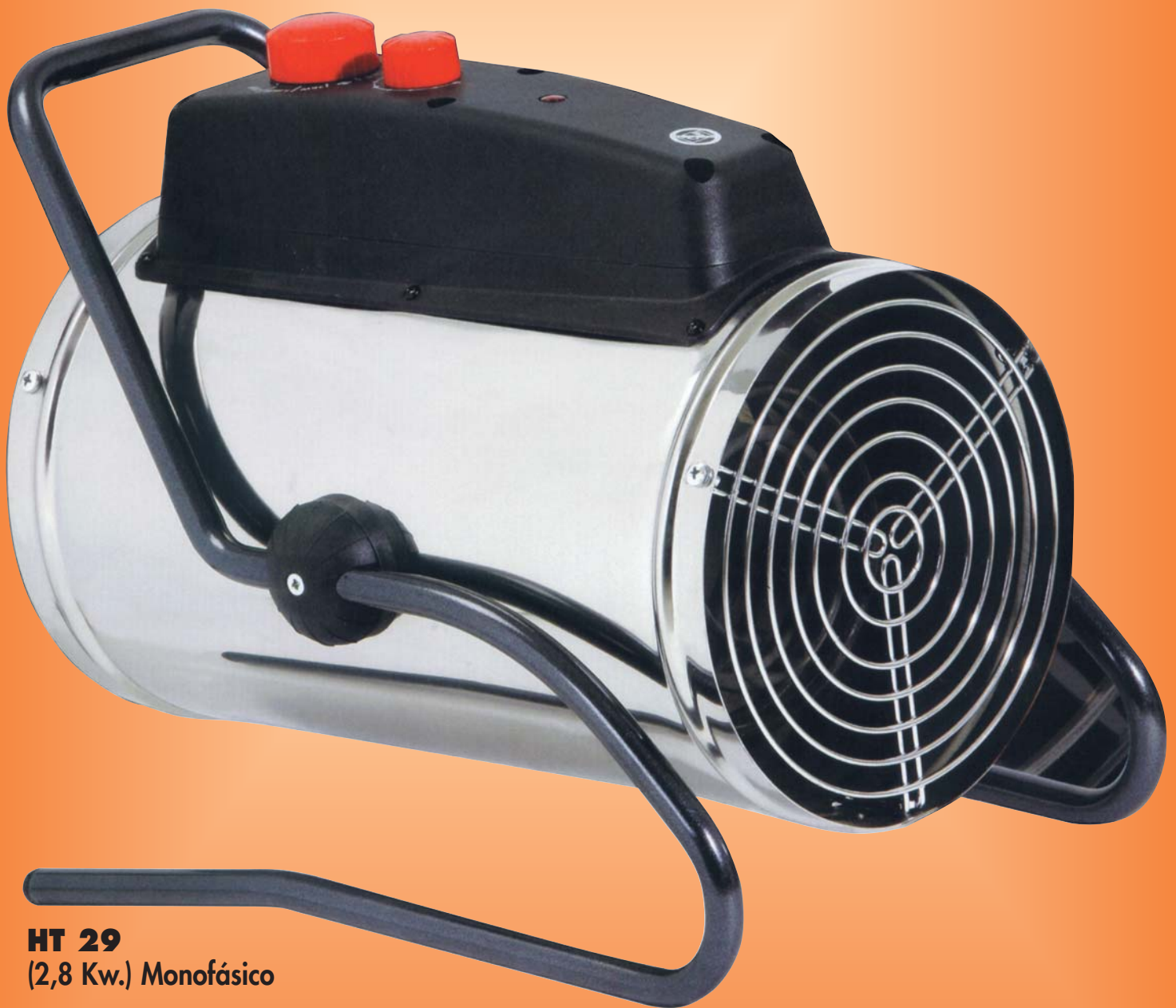
HT 29 (2,8 Kw.) Monofásico