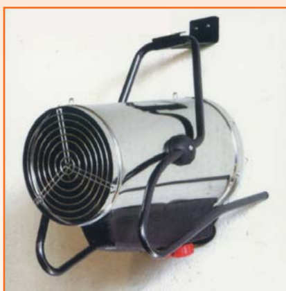
En la pared